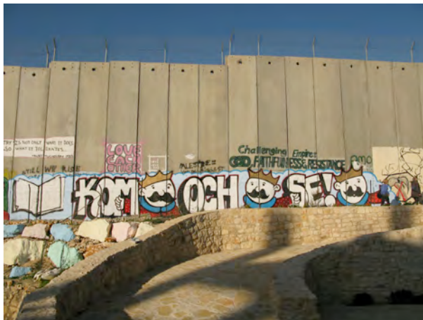
Resultatet av målningen